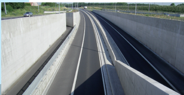
Harelbeke, viaduct E3-Prijs , betonnen wanden beschermd met 'PSS 20'®

Architecten en eigenaars van bouwwerken ontdekken steeds meer de esthetische mogelijkheden van (architectonisch) beton. APP All Remove levert een duurzame bijdrage aan het schoonmaken en schoonhouden van bouwconstructies, met haar unieke dienstverlening en de eigen beschermende producten die in al hun toepassingen WTCB getest zijn: