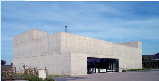
Scherpenheuvel, Pedico , architectonisch beton beschermd met 'ThefApp'® en 'PSS20'®

Architecten en eigenaars van bouwwerken ontdekken steeds meer de esthetische mogelijkheden van (architectonisch) beton. APP All Remove levert een duurzame bijdrage aan het schoonmaken en schoonhouden van bouwconstructies, met haar unieke dienstverlening en de eigen beschermende producten die in al hun toepassingen WTCB getest zijn: