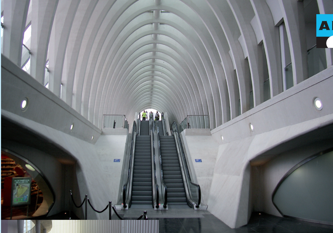
Luxemburg, Nationaal Theater , betonnen vloer (Decomo) tegen vervuiling beschermd met 'ThefApp'®