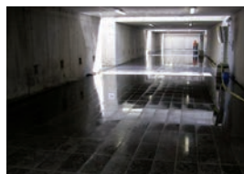
Luxemburg , Centraal Station, tunnel naar perrons, vloeren in blauwe hardsteen met 'ThefAPP' geïmpregneerd.