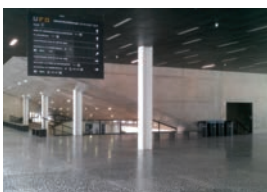
Gent , Universiteitsgebouw UFO, wanden in beton met 'PSS 20' tegen graffiti beschermd.