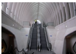
Luik , HSL Guillemins, wanden in beton met 'APP HD' beschermd tegen graffiti.