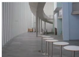
Luxemburg , theater 'Philharmonie', betonnen vloertegels in foyer met 'ThefAPP' geïmpregneerd.