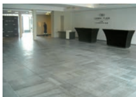
Luik , Crowne Plaza Hotel, vloeren in graniet met 'ThefAPP' geïmpregneerd.