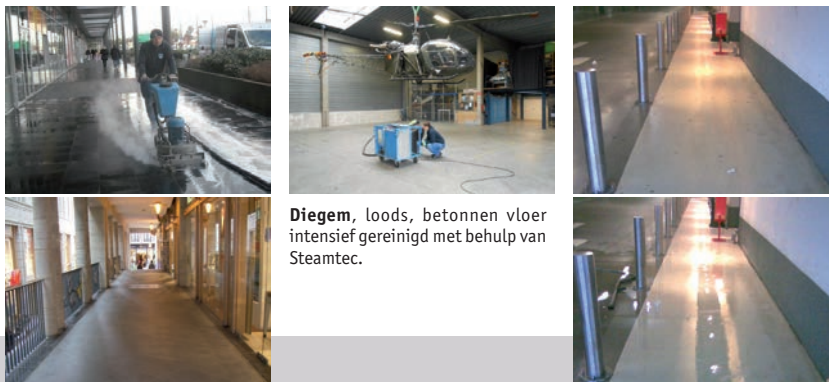
Diegem , loods, betonnen vloer intensief gereinigd met behulp van Steamtec.